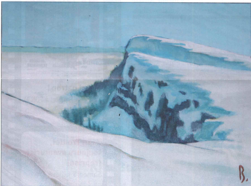
Mont d'Or, neige.

Par contre, les portraits de vaches montbéliardes, parfois avec leurs petits, sont empreints d'une douceur et d'une tendresse qui s'exprime par des tons pastel très adoucis.