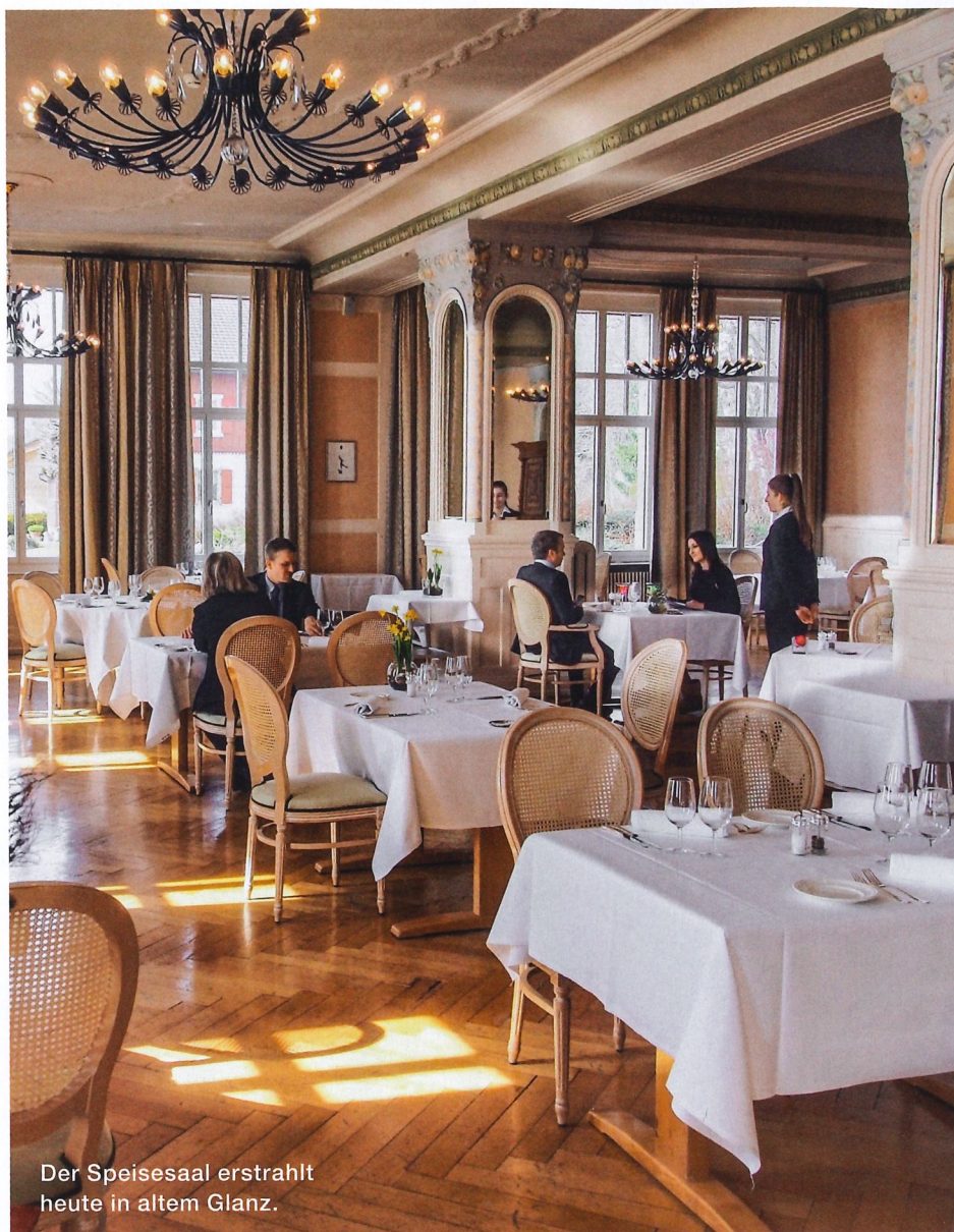
Der Speisesaal erstrahlt heute in altem Glanz.

► Anlage Glace verkaufte, führt auf seine Weise die Philosophie des Gründers Edouard Baierlé fort: möglichst viele Besucher an der Schönheit der Landschaft von Les Rasses teilhaben zu lassen.