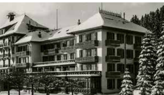
Grand Hôtel des Rasses St-Croix grandhotelrasses.ch

Designhotels. Die schweizweit einmalige Kooperation wurde 2004 gegründet und umfasst inzwischen 58 historische Betriebe – von Landgasthöfen über Kurhäuser bis zu 5-Sterne-Palästen, von Jugendstil-Monumenten über Bauhaus-Zeugen und Palazzi bis zu alpinen Refugien. Wir stellen in dieser Auswahl drei Westschweizer Betriebe in Wintersportgebieten, einen Geheimtipp im Kanton Jura, eine Wellness-Oase im Emmental und das jüngste SHH-Mitglied in Thun vor. ■