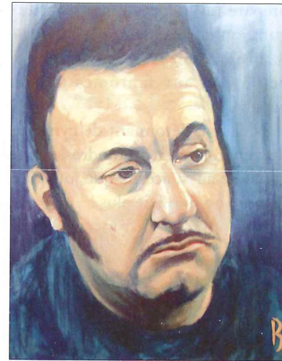
Un Coluche sombre dans « Ciao Pantin ».